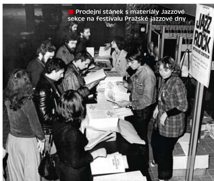
■ Prodejný stánek s materiály Jazzové sekce na festivalu Pražské jazzové dny