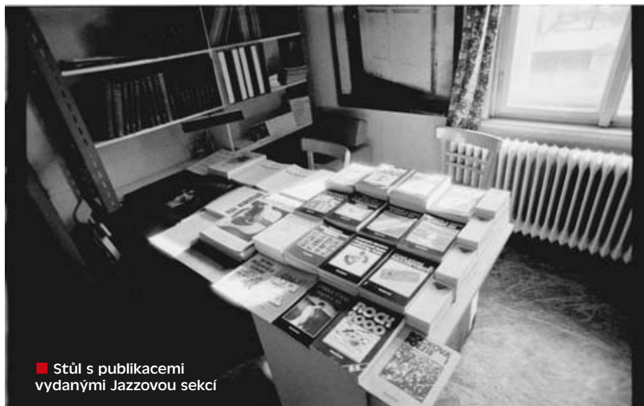
■ Stůl s publikacemi vydanými Jazzovou sekci