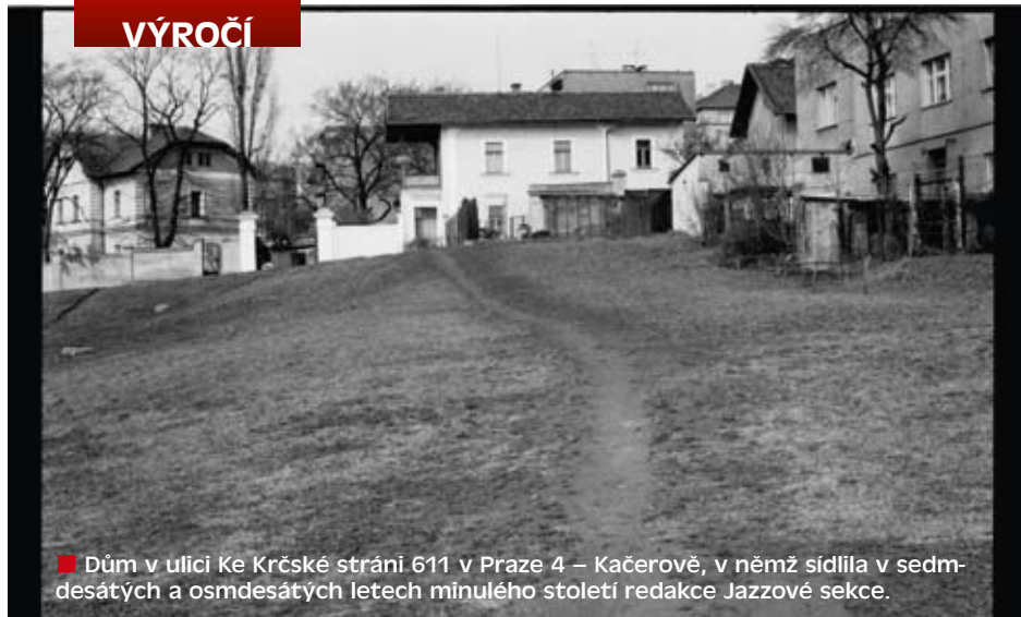
■ Dům v ulici Ke Krčské stráni 611 v Praze 4 – Kačerově, v němž sídlila v sedmdesátých a osmdesátých letech minulého století redakce Jazzové sekce.