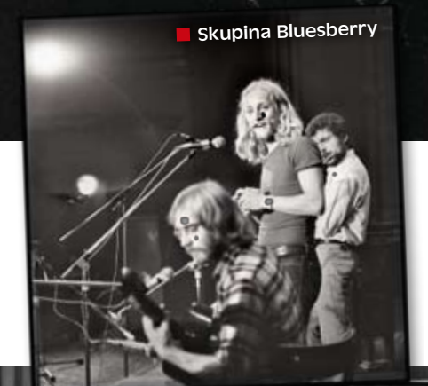
■ Skupina Bluesberry