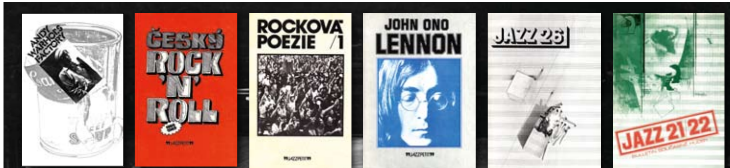
■ Ukázky publikací Jazzové sekce, z edice Jazzpetit a Bulletin Jazz, v grafické úpravě Josky Skalníka