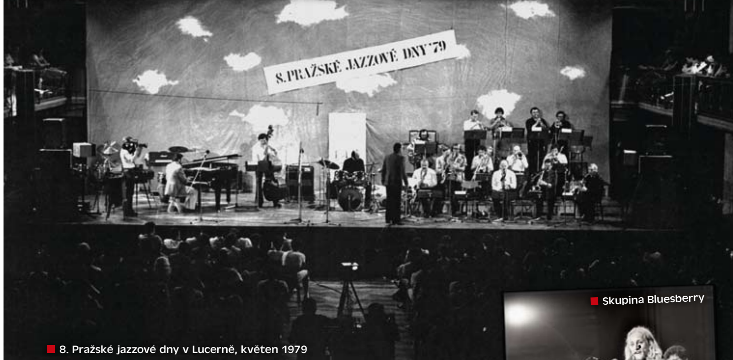
■ 8. Pražské jazzové dny v Lucerně, květen 1979