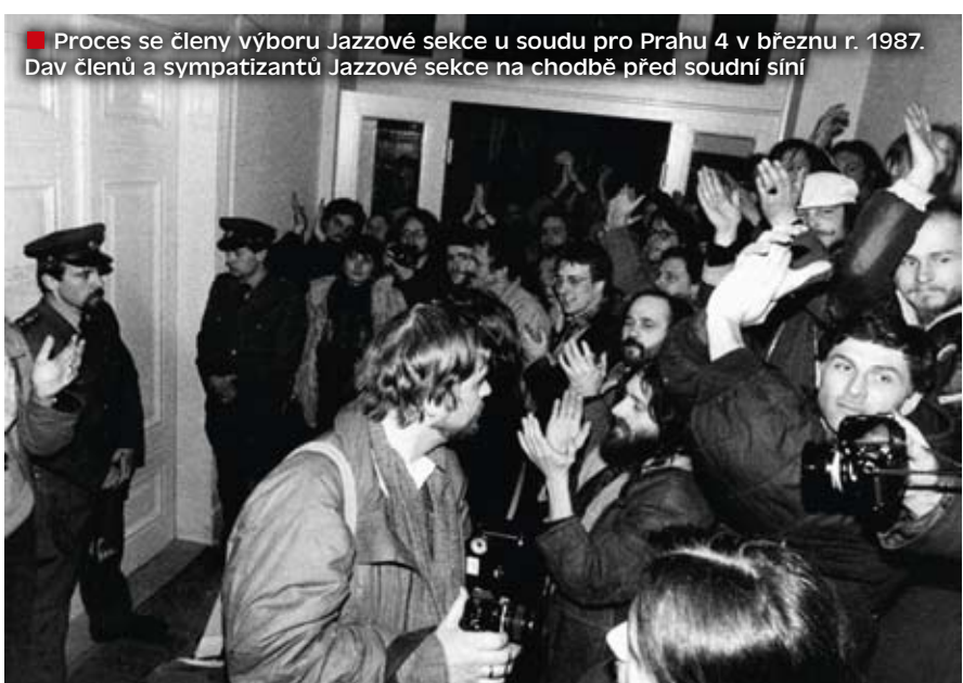
■ Proces se členy výboru Jazzové sekce u soudu pro Prahu 4 v březnu r. 1987. Dav členů a sympatizantů Jazzové sekce na chodbě před soudní síní

První akcí je putovní výstava JAZZOVÁ SEKCE 1971–1988 . Jednadvacet panelů je ojedinelým dobovým svědectvím o činnosti svobodomyšlných a kulturyimilových lidí, aktivistů Jaz-