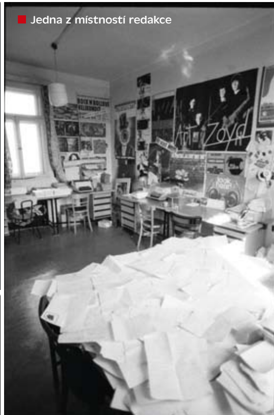
■ Jedna z místností redakce